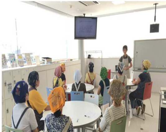
暮らしのセミナー