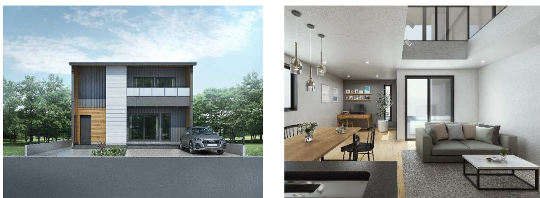
図1 「OTSハウス」新モデル 外観・内観

近年では日常生活を脅かす災害の多発により、水や電気などのライフラインに対する意識が大きく変化しつつあります。また、新型コロナウイルス等の疫病の発生など複合的災害の危機に直面している現代社会において、災害発生時にも平常時と同じ生活を送ることができる「OTSハウス」はこれからの私達の生活に適応した住宅であると言えます。